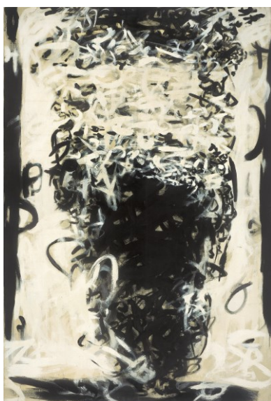
Metamorfosi , 1960 tempera su tela, 195 x 130 cm Collezione Prada, Milano

Per l'occasione viene pubblicato un ricco volume edito da Skira, con i saggi di Fabrizio D'Amico e Francesco Tedeschi, cui si deve inoltre la conversazione incentrata sulla militanza di Sanfilippo nell'ambito del Gruppo Forma, che consente di delineare le premesse alla stagione matura della sua ricerca, oggetto della mostra. Nel "catalogo delle opere" ciascuno dei lavori esposti è analizzato criticamente da Paola Bonani, autore anche della dettagliata biografia che ricostruisce lo stimolante contesto nel quale l'artista opera in quegli anni, corredata da una raccolta di documenti e fotografie in parte inediti in collaborazione con Laura Lorenzoni. In chiusura, un'ampia sezione di apparati, il repertorio delle mostre personali tra il 1950 e il 1961 a cura di Elena Dalla Costa, e una antologia di lettere, recensioni e scritti, scelti a documentare i rapporti con personalità ed eventi che nel decennio hanno scandito la vicenda di Sanfilippo.