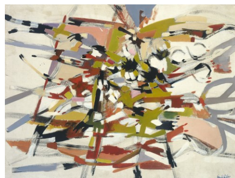
Senza titolo, 1953 olio su tela, 62,7 x 83,5 cm, collezione privata

Dal 1952, quando comincia a sondare le potenzialità del segno liberamente steso sulla tela, avvia la sua collaborazione con il gallerista Carlo Cardazzo, esponendo dapprima alla Galleria del Cavallino a Venezia, poi al Naviglio a Milano. Sono occasioni che gli consentono di confrontarsi con le ricerche degli spazialisti e di alcuni esponenti dell'informale segnico vicini allora a Michel Tapié, che nel 1956 lo annovera tra i protagonisti dell' art autre e nel 1958, dopo averlo presentato nella personale in gennaio alla Galleria d'Arte Selecta a Roma, lo invita a esporre in aprile a Osaka accanto a Pollock, Kline, de Kooning e ai giapponesi del Gruppo Gutai. Il suo rapporto con il contesto internazionale si rafforza con la partecipazione, tra il 1957 e il 1958, alle iniziative della Rome-New York Art Foundation, importante luogo di incontro di artisti, collezionisti e critici del calibro di Herbert Read, James Johnson Sweeney e Lionello Venturi, e alla fine del decennio con le esposizioni alla New Vision Centre Gallery di Londra, punto di riferimento delle avanguardie più vitali in ambito europeo e del collezionismo anglosassone.