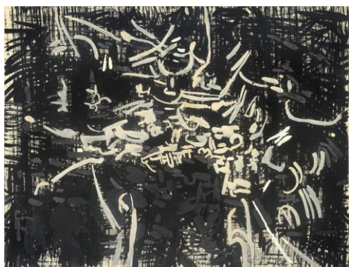
Animale immaginario , 1955 tempera su tela, 64,5 x 84,8 cm, collezione privata