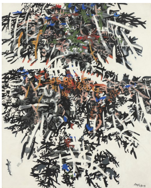
Rete complicata , 1957 tempera su tela, 100 x 81 cm, collezione privata

Il percorso della mostra, con trentasei opere, è suddiviso in tre sezioni che testimoniano di quel periodo decisivo della ricerca di Sanfilippo, situata fra le aspirazioni giovanili a un rinnovamento formale e l'espansione pluriforme del segno negli anni '60. Si apre con tre lavori del 1951 in cui si riconosce il progressivo allontanamento dal linguaggio neocubista e lo spostamento verso un'astrazione più radicale, di stampo neoconcreto. Un cambio di direzione, questo, documentato da Azzurro , uno dei primissimi dipinti del 1951, scelto per l'importante rassegna Arte astratta e concreta in Italia- 1951 alla Galleria Nazionale d'Arte Moderna di Roma. Influenzato dall'opera matura di Kandinsky e di Hartung, nel 1953 Sanfilippo libera la struttura dei suoi quadri dalla rigidità delle forme geometriche, lasciando spazio a una gestualità più accesa che anima improvvisamente la superficie delle sue tele, come nel primo Senza titolo del 1953 qui riprodotto. Trova quindi un suo modo del tutto originale. Come appare evidente nell'altro Senza titolo del 1953, l'uso di un particolare pennello gli permette di tracciare con un solo gesto un largo reticolo di linee parallele sull'intera superficie della tela, riconducendo così entro uno schema preciso la carica gestuale che si sta allora riversando nella sua pittura.