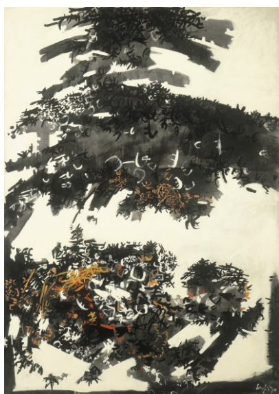
Senza titolo , 1957 tempera su tela, 162,3 x 114 cm collezione privata

Questo suo turbamento si traduce in un segno che si allunga, filante, che si flette e si ammatassa, immerso in un gorgo di materia in subbuglio, come avviene in Metamorfosi del 1960 qui illustrato. Poco dopo, ancora nel '60, quel groviglio si spaccherà in due corpi distinti, sospesi in un'atmosfera rarefatta, come provano i lavori a chiusura della mostra, che annunciano le immagini tipiche del decennio successivo.